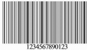
Izgled bar-koda za vozila